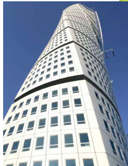
© HSB Turning Torso, Fotograf: Pierre Mens

MIN POÄNG MED detta lilla exempel är att vi bör tänka utanför de traditionella ramarna och se lösningar som inte vid första anblicken är självklara. Det gjorde man i Hällefors för flera år sedan. Jag är säker på att Måltidens hus och Formens hus kommer att få monumental efterföljare som synliggör regionens visioner och framåtanda. Vattenparken vid Hjälmarens är ett annat exempel. Diskussio-